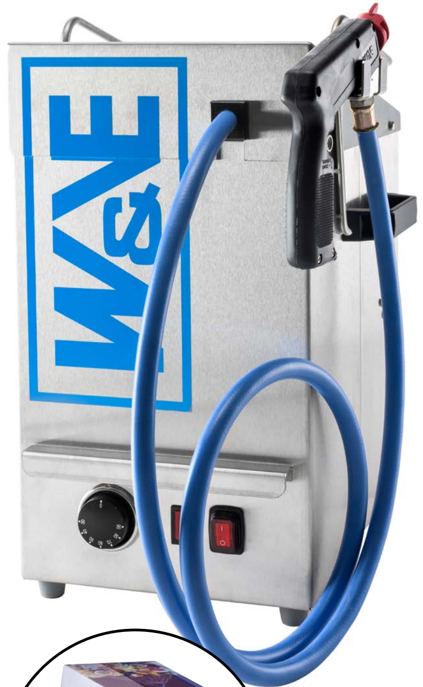
TABLE Top JELLYSPRAYING MACHINE